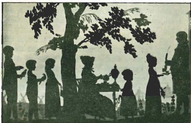
Familien Ostermann 1818.

gyndte at blive kendt blandt Bønderne her paa Egnen. En af de første Banebrydere var en velstaaende Gaardmand i Kelleklinte. Han købte et lille Parti raa Kaffebonner og fik i Butiken nøje Besked om, hvorledes han skulde brænde, knuse og iøvrigt behandle dem. Da Manden atter kom til Byen, erklærede han sig meget misfornøjet med den nye Ret, og paa Spørgsmaalet om, hvorledes