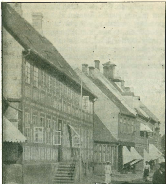
Den gamle Købmandsgaard.*)

København. Til denne Vogn, som kaldtes „Skarp- rettervognen“, knyttede sig følgende Historie.